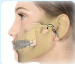
Kohene diagnoos ja TMJ häire ravi