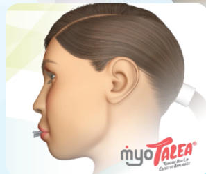
MRC tegevusprogramm ja kirtee kõigile vanuserühmadele